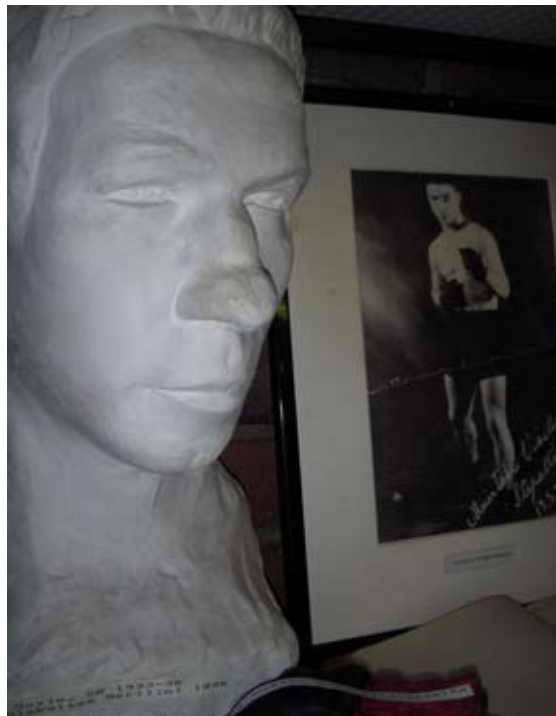
Sten Suvio rintakuva / bust

Ensimmäinen suomalainen nyrkkeilyn olympiavoittaja Berliinin kisoista 1936.