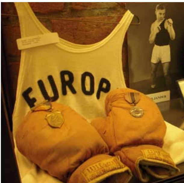
USA-Eurooppa-ottelun paita ja hanskat Gloves and vest of the USA-Europe Contest

The First Finnish Olympic Champion, Berlin 1936.