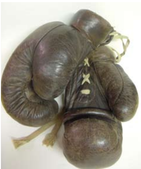
Helsingin olympiakisojen hanskat, 1952. Gloves used in the Helsinki Olympic Games, 1952.